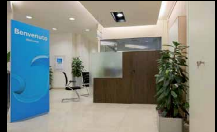
Istituto di Credito Barclays Bank Realizzazioni chiavi in mano di Sportelli Retail - Italia Area accoglienza Spazi operativi