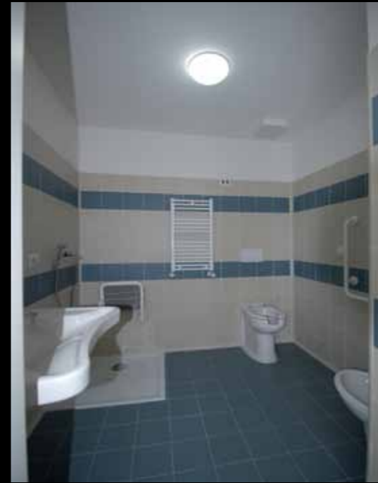
Casa di cura San Luca - Roma Ristrutturazione chiavi in mano del piano quarto degenze e della sala operativa hospice.