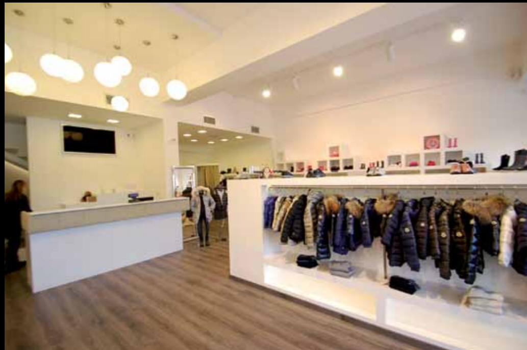
Manzetti Junior clothing store for children - Rome Turnkey of stores