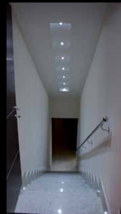
Barclays Bank Executive Office - Rome Turnkey of offices and meeting rooms