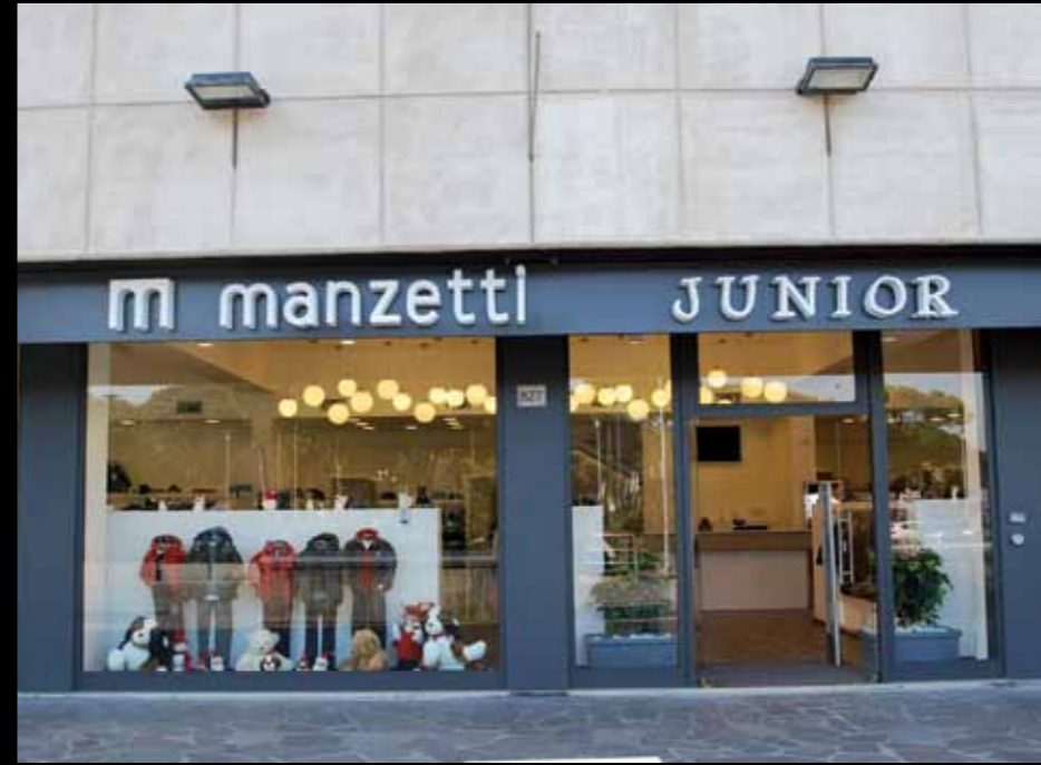
Manzetti Junior abbigliamento per bambini - Roma Realizzazione chiavi in mano di esercizi commerciali