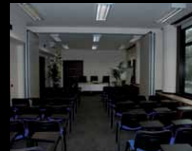
Uffici Direzionali Barclays Bank - Roma Realizzazione chiavi in mano di uffici e sale congressi