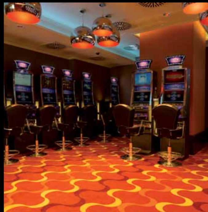
Slottery Las Vegas - Milano Realizzazione chiavi in mano di Sale VLT (Video Lottery Terminal)